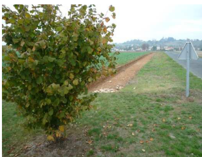
Premiers travaux rue de la plaine

La municipalité a un projet de voies cyclables et piétonnières reliant St Maixent à Exireuil longeant la rue de la Plaine et la rue de Chausseroi (1), empruntant l'ancienne ligne de tramway et l'impasse du Coteau (2), desservant le Puits d'Enfer (3) et redescendant vers St Maixent par le chemin des Basselles (4) et le chemin de la plaine (5).