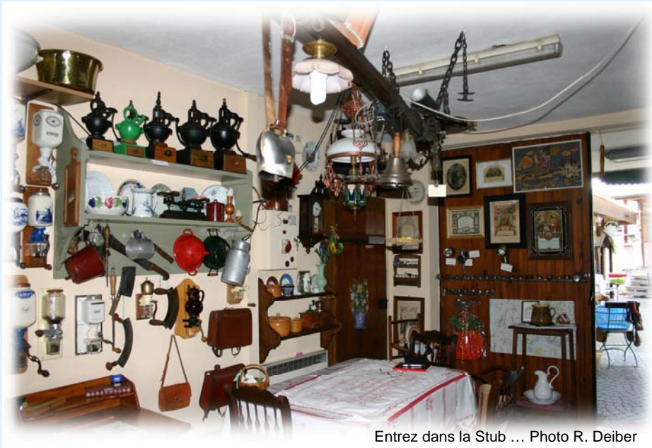
Entrez dans la Stub ...

A cet égard, il suffit de lire le magnifique "Livre d'Or", dans lequel on peut remarquer des propos enthousiastes de personnes venues du Canada, d'Allemagne, de Belgique, d'Auvergne, de Bretagne et d'Alsace, qu'elles traduisent par des mots ou des expressions, tels que, "émotion, étonnant, passion partagée, voyage dans le temps, merveilleux souvenir, rêve, exposition digne d'un véritable musée".