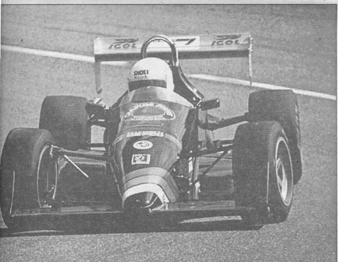
Anderegg aussi à l'aise en côte qu'en slalom termine second.