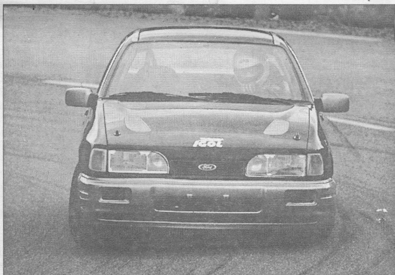
Les victoires en groupe N se succèdent pour Lionel Divoux.