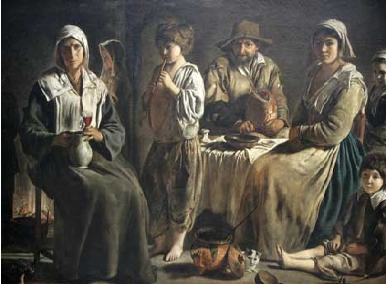
Louis Le Nain, Famille de paysans , 1642.