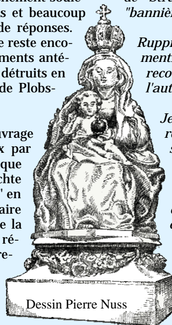
Dessin Pierre Nuss

Selon Winterer, une Chapelle de pèlerinage fut érigée vers 1147 qui englobait le tronc d'un chêne sacré.