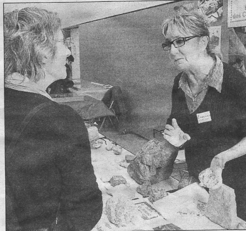
La Baie de Saint-Brieuc fait partie des écosystèmes les plus productifs du monde. Mais elle compte aussi des richesses géologiques. Ci-dessus, on discute entre passionnés de l'origine des galets de Cesson.