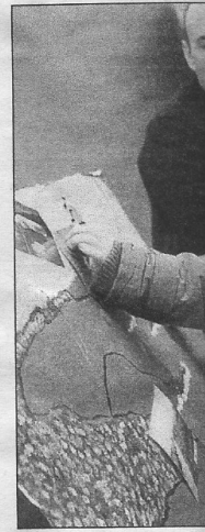
Sur le stand du centre perméable-en-Mer, Jules, 5 ans, de la littoral breton, sous l'œ