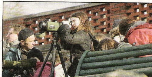
En baie de Saint-Brieuc, à la découverte des oiseaux migrateurs.

Les enfants, curieux de nature ont pu participer aux nombreuses animations qui leur étaient proposées afin de les sensibiliser aux secrets de la nature. Certains se sont attardés près des stands consacrés aux chauves-souris, espèce animale encore mal connue, qui