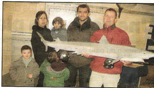
Les poissons aussi sont naturalisés.

Cette grande fête de la nature a encore été un succès, et les motivés par l'écologie se sont tous retrouvés durant le week-end au parc des expositions de Brézillet. Une quarantaine d'associations ont présenté un large éventail des multiples facettes de la nature costarmoricaine, petits et grands ont été éblouis par ce festival de la biodiversité. Papillons, chauve-souris, mammifères, oiseaux des bords de