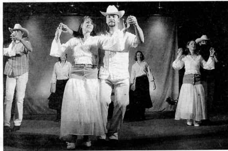
Premier grand spectacle des Country's Beroy.

Danse en couple (avec ou sans partenaire) 10h-11h30 : technique partner pour tous ; 11h30-13h : niveau débutant-novice ; 13h-14h : pause repas ; 14h-16h : atelier couple two step ; 16h-17h : atelier couple night club (enseignement rare en France). Tarifs : gala (dîner, spectacle, bal) 25 euros, spectacle-bal 12 euros, bal 6 euros. Renseignements : 05.59.77.47.99 ou 05.59.81.54.80