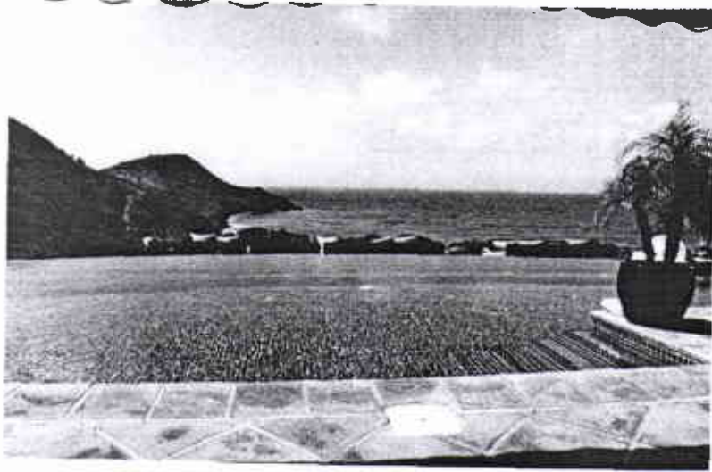
5 Vista do hotel para Anse de Toiny 6 Hotel La Samanna 7 Vila com piscina do hotel La Samanna

termos de praias, a ilha é esculpida num litoral único em perfeita harmonia com a beleza natural. Cada ângulo da ilha proporciona uma surpresa que jamais será igual a precedente. A parte francesa é, sem dúvida, a mais bonita. Um passeio recomendável é ir até o Pico Paradis, com 414 metros. Uma caminhada de manhã pelas "terres basses"