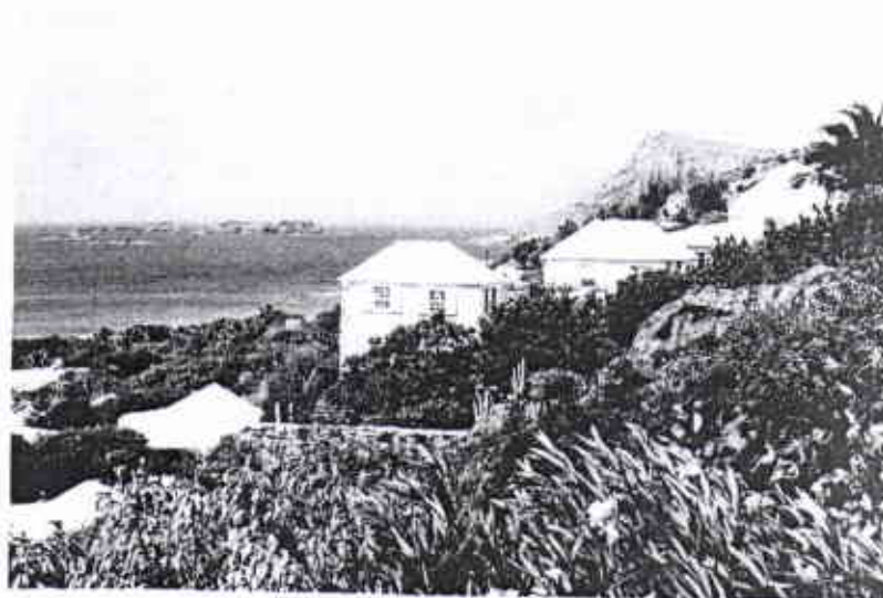
3 Vilas privadas no hotel le Toiny 4 Marigot, a capital da ilha St. Martin

O nome correto da ilha é São Martinho de Tours, mas todo mundo a conhece como St. Martin. O nome lhe foi dado por Cristóvão Colombo na sua segunda viagem ao Novo Mundo. Fatos constatarem que no dia 11 de novembro de 1493, data da festa do santo, Cristóvão Colombo avistou a ilha e daí o nome. Os espanhóis, que já haviam colonizado várias ilhas próximas, queriam conquistar St. Martin, mas após um ataque mal sucedido recuam e dei-