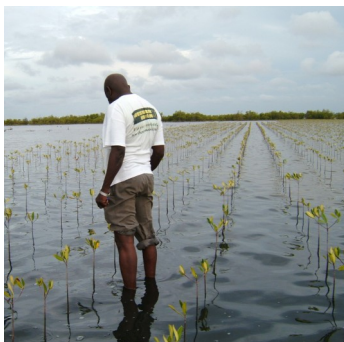
Plantation de milliers de palétuviers

BCV compte no. CH 33 0076 7000 Z516 5664 4