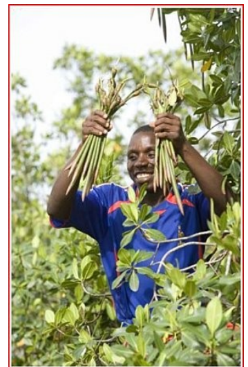
Graine de palétuviers

les peut séquestrer 500 tonne équivalent CO 2 par hectare.