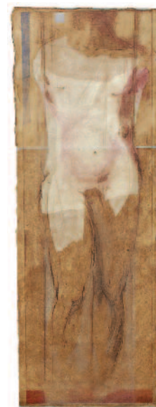
Un homme - 2003 eau-forte 106 cm x 29 cm

contacts : Sylviane CANINI 40 avenue Gabriel Péri 92260 Fontenay aux Roses FRANCE Tél. : 01 46 60 05 25 sylviane.canini@free.fr www.sylvianecanini.com