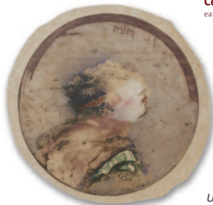
Continent Alpha - 1999, eau-forte 49 cm x 52 cm