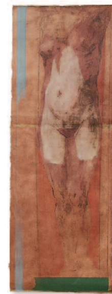
Une nubile - 2004, eau-forte 106 cm x 29 cm