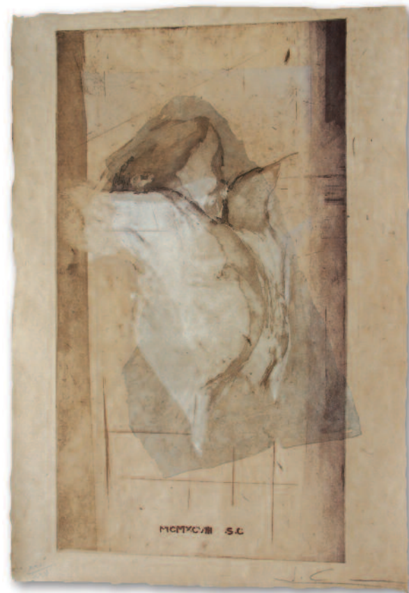
Yama mata yama II - 1998, eau-forte 92 cm x 67 cm

Le papier est un lieu avec tout le pouvoir d'évocation que cela sous-entend : riche vélin de France, Tosa washi du Japon, lisse et lustré comme un miroir, papier Lokta du Népal tout en matière organique et en couleur, le Hong sing si fin et si délicat venant de Chine... Tous attendent d'être pressés, imprimés, froissés, gaufrés et même teints. Sa souplesse est sans fin. Et il n'est pas rare que la rencontre d'un nouveau papier me pousse vers des chemins tout tracés par son essence même.