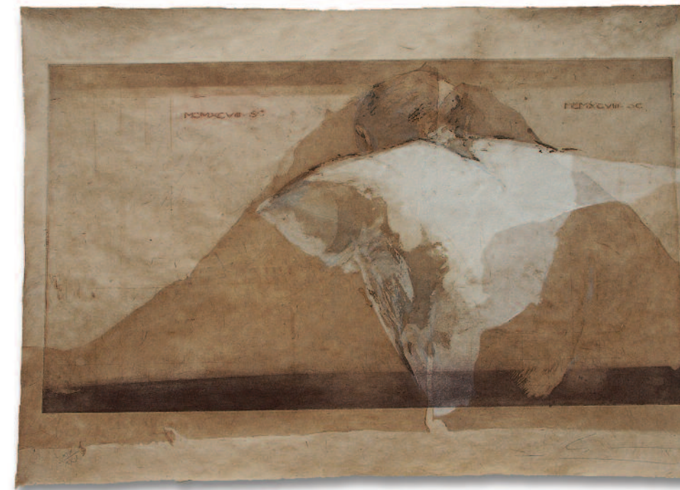
Yama mata yama I - 1998, eau-forte 67 cm x 92 cm