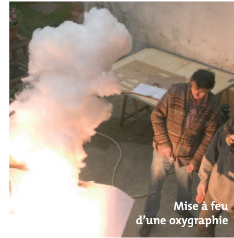
L'ange nu - 2005, oxygraphies sur tissu 103 x 69 cm