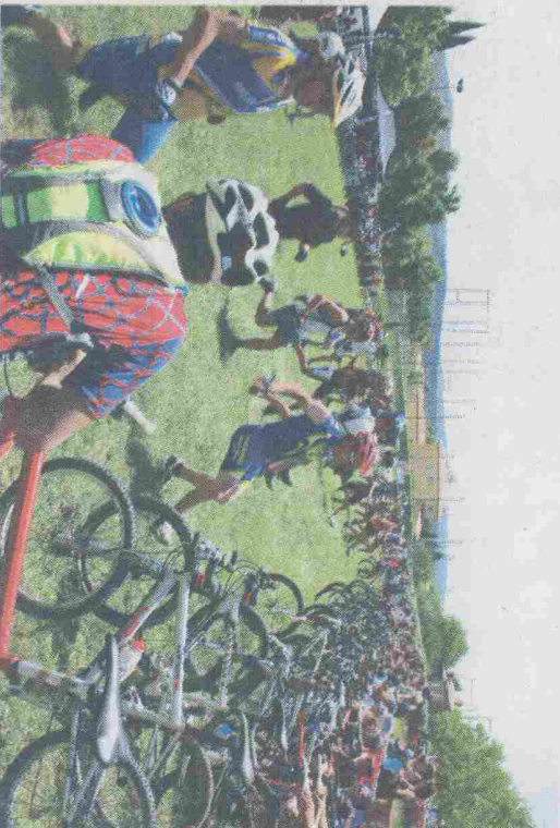
Le départ des vistes.

Si, bien sûr, la manifestation principale, le trait d'union de ces journées fut la compétition de VTT, les autres activités programmées ont permis d'animer les moments de repos des coureurs, des accompagnateurs et des spectateurs. Ainsi se sont succédés une démonstration de golf, de l'aéro modélisme (déporté au stade pour des raisons de sécurité), un match artisanal et de produits du terroir en semi-nocturne, le tout au son d'un orchestre qui assura la partie musicale, et sonore de ces journées. Mais pour que cette grande fête ait lieu, aboutissement de plusieurs mois de préparation du club local Naturbike, il fallut que toute l'équipe des bénévoles regroupée autour de son président