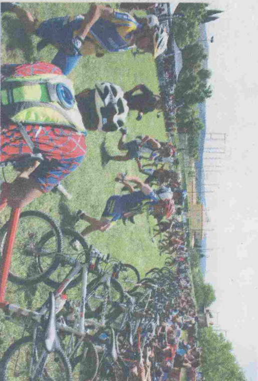
Le départ des vistes.

Si, bien sûr, la manifestation principale, le trait d'union de ces journées fut la compétition de VTT, les autres activités programmées ont permis d'animer les moments de repos des coureurs, des accompagnateurs et des spectateurs. Ainsi se sont succédés une démonstration de golf, de l'aéro modélisme (déporté au stade pour des raisons de sécurité), un match artisanal et de produits du terroir en semi-nocturne, le tout au son d'un orchestre qui assura la partie musicale, et sonore de ces journées. Mais pour que cette grande fête ait lieu, aboutissement de plusieurs mois de préparation du club local Naturbike, il fallut que toute l'équipe des bénévoles regroupée autour de son président